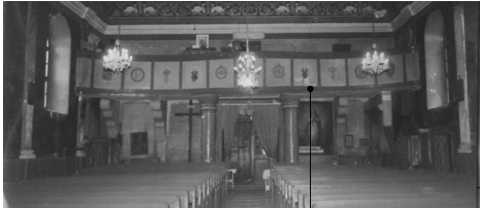
Интериорна снимка към балкона на църквата, 1980г. Възстановяване на декоративен фриз на балкона по архивни данни